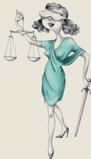
ILLUSTRATION: ELIANE DUVEKOT

Förbundets jurister besvarar dina juridiska frågor. Skicka frågorna till adm@slff.se.